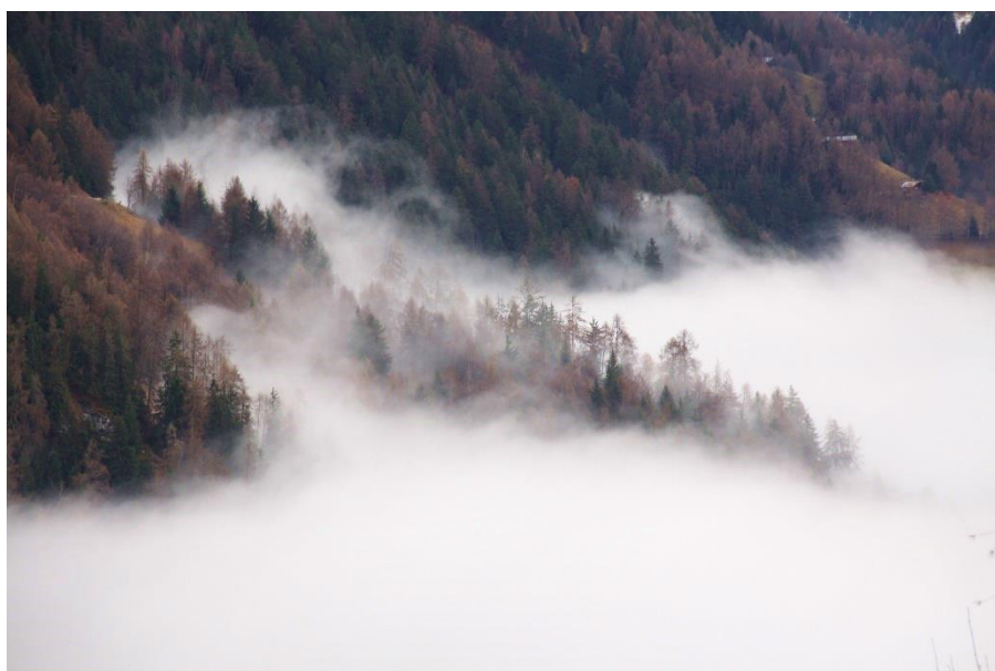
« Danse blanche »

Avec sa biodiversité incroyable et sa nature flamboyante, le Costa Rica abrite 27 parcs nationaux. Ces réserves naturelles offrent des sujets de peinture fascinants. Depuis petite, j'adore la nature et passe souvent du temps à l'extérieur. Ce voyage en sac à dos, me permettra de me déplacer à pied et de peindre les paysages qui m'entourent lorsque je le souhaite. Dans cet esprit, j'aimerais faire de nombreux treks à travers cette nature luxuriante. Traversant les forêts tropicales couvertes de brume et en capturant le mouvement grâce à mes coups de pinceaux. Cependant, une peur qui me suit est de me retrouver sur les chemins battus de milliers de touristes. C'est pour cela que je souhaite décider mes marches et mes destinations après en avoir parlé avec des locaux, par exemple pendant que je fais mon cours de langue à Tamarindo. Quelques idées trottent dans la tête, comme traverser le parc national de La Cangreja qui est supposé être le parc le moins visité du pays à pied sur plusieurs jours. Cela me permettrait une immersion dans la nature de ce pays, m'inspirant à la création et me poussant à explorer de nouvelles perspectives artistiques.