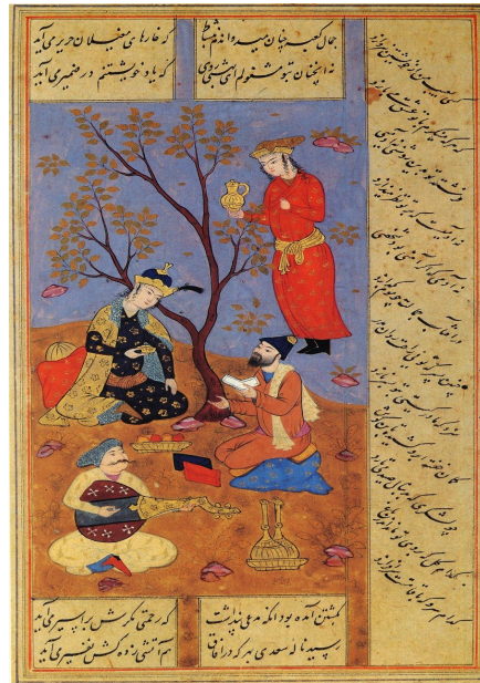
miniature persane illustrant le recueil Bustan (le verger) du poète Saadi

Aux premiers rayons de l'amitié qui nous lie, dans une forte poignée de main, nous nous sommes solennellement juré de partir ensemble, de parcourir le monde au cours d'un long voyage. Dur comme pierre nous y croyions. Nous imaginons mille périples possibles à travers des contrées encore inconnues que nous rêvions de découvrir. Le monde est grand et notre désir d'aventure et de découverte sans fin. En attendant, nous voyagions à travers les images, la peinture, les livres.