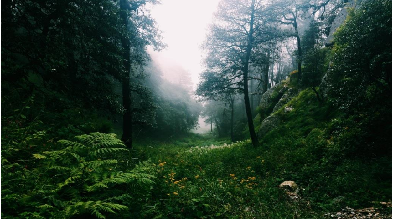
Forêt de l'Himalaya, Inde

Dans notre imaginaire, le voyage n'est pas fait de villes et de routes mais surtout de paysages où la tranquillité de la nature règne. C'est dans un tel cadre que la recherche de la sobriété heureuse est le plus favorable, bien que l'on puisse la trouver aussi dans des lieux bondés. Notre but serait donc de faire un grand nombre de randonnées et pèlerinages, ainsi que de se rendre dans de grands lieux de recueillement spirituel comme Benarès et Lumbini pour pouvoir trouver la paix. Dans le Désert du Thar en Inde, dans les alentours du Lac de Pokhara au Népal, dans les sentiers de Koya San, nous pourrions faire des randonnées et de la marche dans le but de pouvoir s'arrêter et apprécier. Loin de la foule. La nature fera entièrement partie de notre retour aux sources, hors du temps.