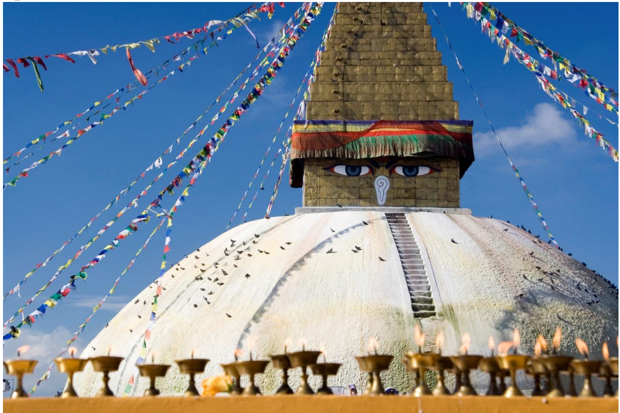
Stupa de Boudhanath à Kathmandou

L'hindouisme, le bouddhisme, le shintoïsme ; ces trois croyances sont intimement liées de par leur histoire et leur géographie. Ces trois pays contiennent une diversité religieuse impressionnante, ceci dû au fait que la tolérance y est une valeur centrale. L'Empereur Ashoka, par exemple, au troisième siècle avant J.-C., avec son ahimsa (non-violence), a toléré le bouddhisme et l'a promu en érigeant de nombreux stupas. En Inde, bien qu'il y ait une majorité d'hindous (environ 80%, comme au Népal), d'autres croyances y sont présentes (musulmane, sikh, chrétienne, bouddhiste, jaïniste, etc.) Ce qui nous intéresse, c'est aussi le respect porté aux animaux par le végétarisme (trois quarts de la population en Inde). Au Népal, la religion bouddhique est fortement influencée par le bouddhisme tibétain. La philosophie bouddhiste est quant à elle tolérante de par le fait que n'importe qui peut y adhérer et suivre de la manière qu'il l'entend les enseignements de Bouddha. La croyance shinto populaire est sans dogme, morale ou hiérarchie. Elle est en quelque sorte fondée par le bas, c'est-à-dire que c'est le peuple qui la fait vivre. Le shinto est très proche de la nature et du culte des ancêtres ce qui fait que le Japon est un pays très attaché aux anciens.